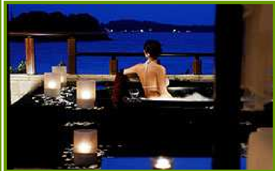
Banyan Tree Bintan. Mapa de Ubicación