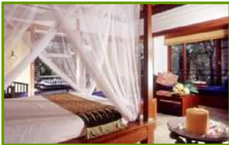
Banyan Tree Bintan. Seaview Villa