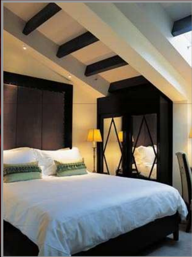
The Scarlett Hotel,